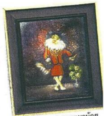
▲ Le Chat-Nel 2 ภาพแมวน้อยใส่ชุดชาแนลที่เคยประดับไว้ในร้านชาแนล ปัจจุบันทางมูลนิธิฯ ซื้อคืนมาเก็บไว้