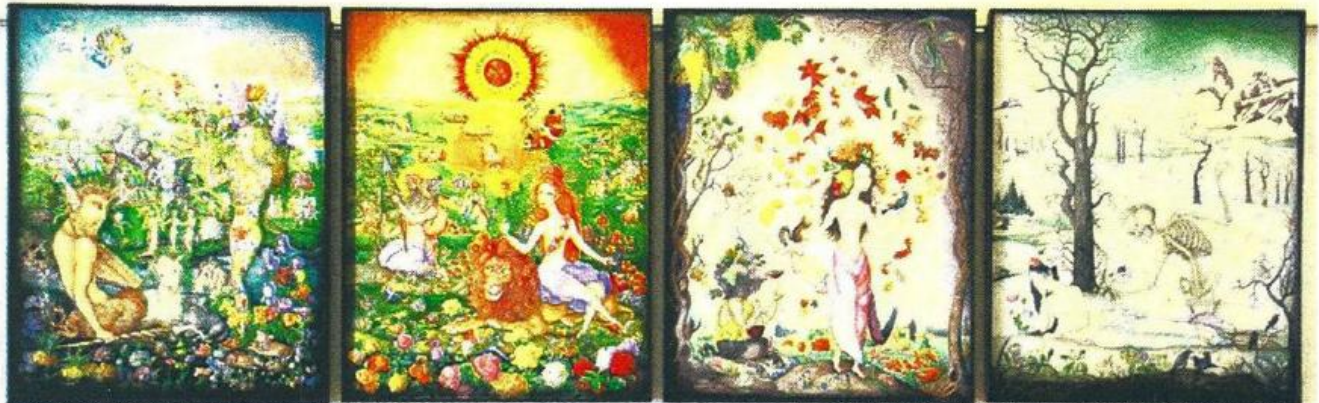
▲ ภาพจิตรกรรมที่นำเสนอเรื่องฤดูกาลทั้ง 4