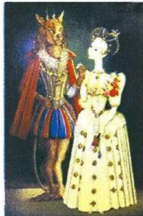
» La Belle et la Bete

» ภาพจำลอง ห้องทำงานของ ท่านหญิงที่มีทั้ง นกแก้ว นกมาคอว์ สุนัข และ แมว อยู่อย่างอิสระ